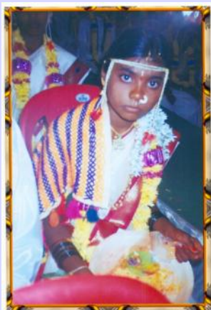
Etat du Karnataka (Inde)